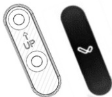
Magneettinen seinäkiinnike ja suojararra