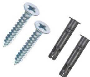
Kiinnitysruuvit ja tulpat